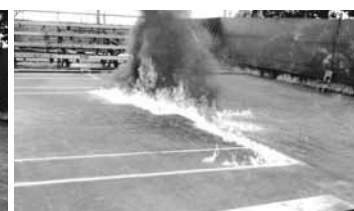
Sécher les courts en 1940 avec de l'huile de coude et de la benzine.