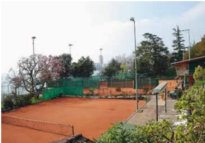
Les installations du MTC: Un îlot de verdure au bord du lac Léman.