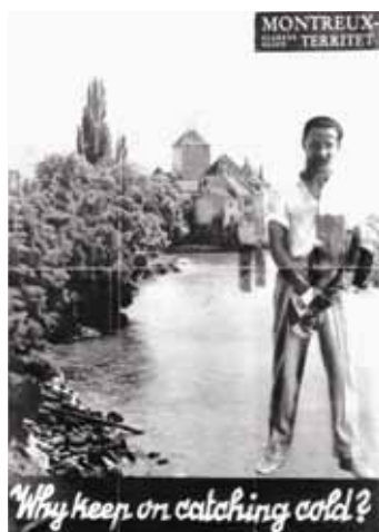
La pub qui aura valu l'exclusion de H. C. Fisher.