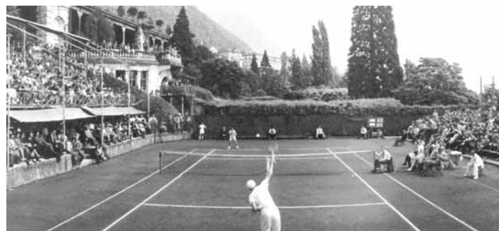
Coupe Davis 1946 : Suisse-France à Territet.