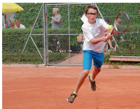
Les juniors s'envolent de plaisir.