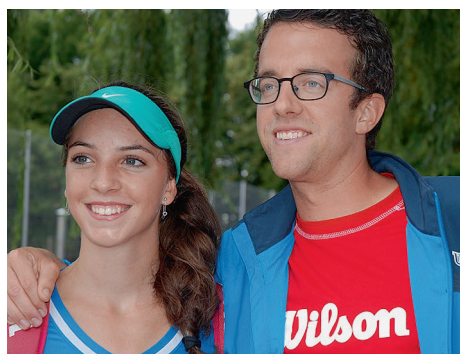
Complicité entre coach et joueuse.