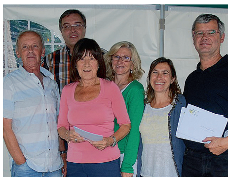
Un comité où règne la bonne humeur.