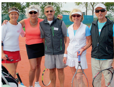
Le tennis oui, mais l'amitié avant tout!